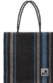
▲ ミッドナイトブラック