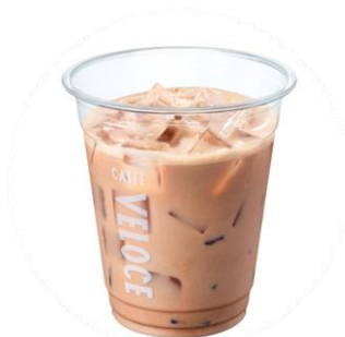
プロテインドリンク ダブルチョコレート

2つのチョコレートフレーバーがブレンドされた、ゴールドジムの高品質なプロテインパウダーに、ミルクをあわせました。