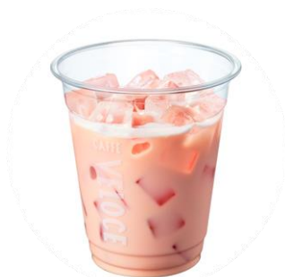
プロテインドリンク ミックスベリー

甘酸っぱいストロベリーとブルーベリーのフレーバーがミックスされた、ゴールドジムの高品質なプロテインパウダーに、ミルクをあわせました。