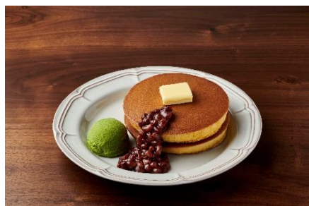
トラディショナル・ホットケーキ 北海道小豆&抹茶アイス

シンプルなトッピングで楽しむ。 「トラディショナル・ホットケーキ ホイップクリーム付き」 バターとホイップクリームで、ホットケーキ生地本来の味わいを シンプルにお楽しみいただけます。 珈琲館ブランドで人気 No.1 のメニューです。