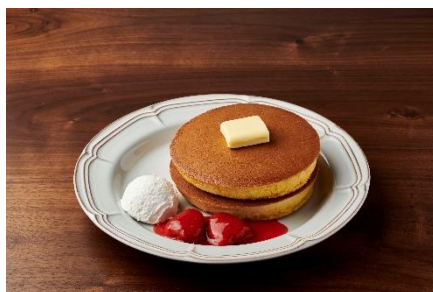
トラディショナル・ホットケーキ 丸ごと苺ソース&ホイップクリーム