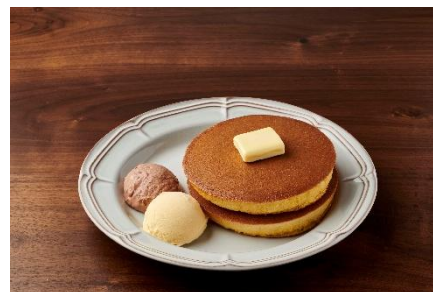
トラディショナル・ホットケーキ バニラアイス&チョコクリーム